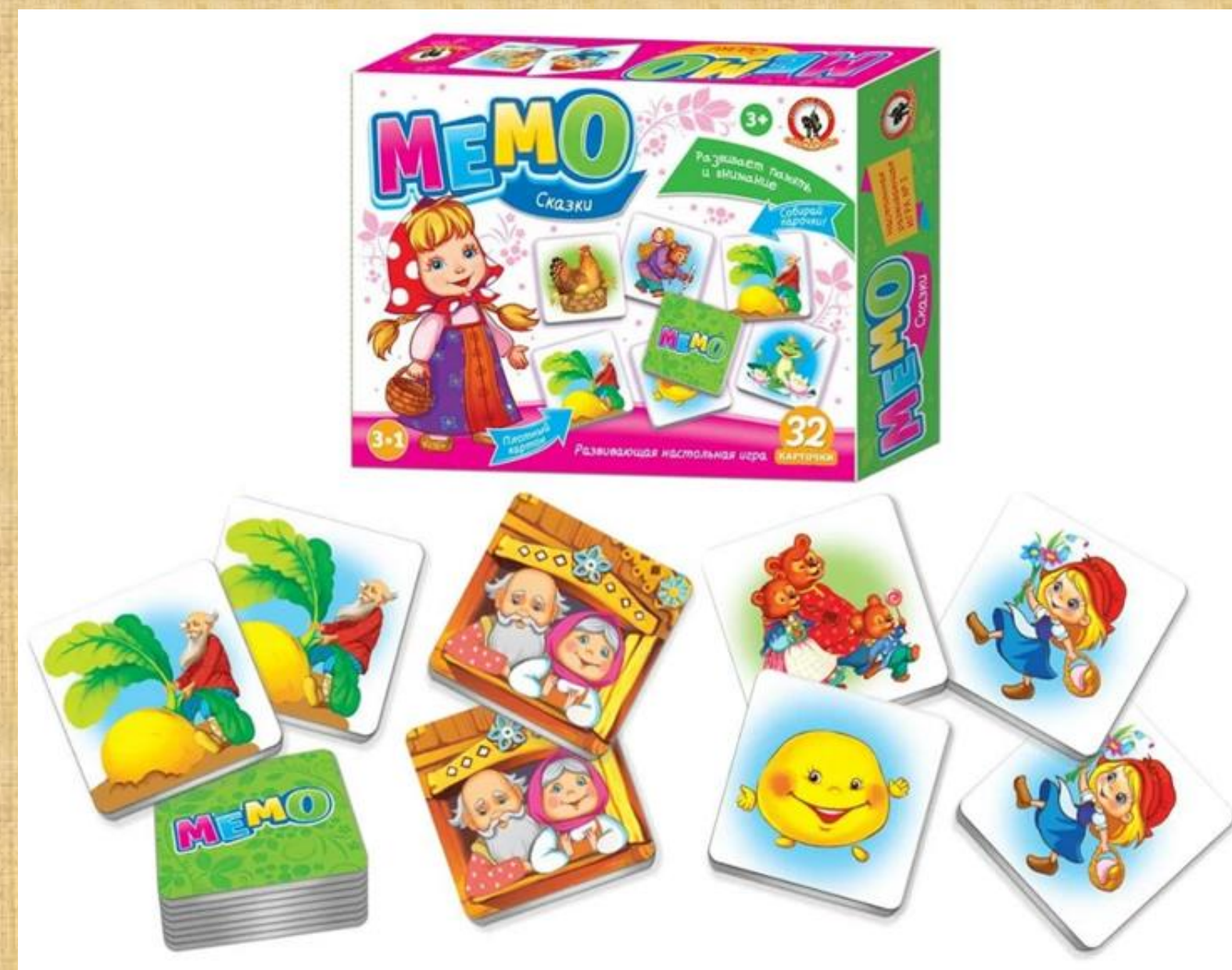
Рисунок 2. Игра-мемо «Сказки»